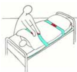
Fixieren der Patienten