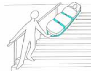
Rettung über Treppenhaus