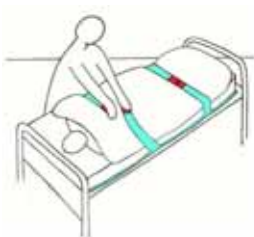
Fixieren der Patienten